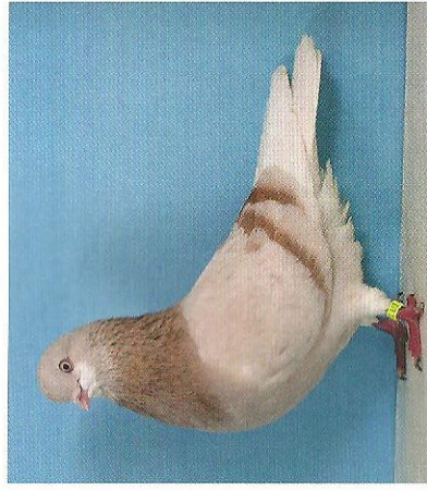
1,0 Amsterdamer Bärtchentümler, gelbfahl, VDT-Schau Leipzig 2011, v EB (Wilhelm Breitwieser, Niddatal)